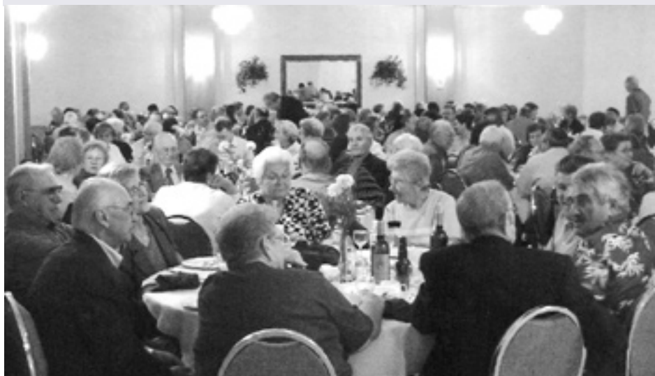
A full house is waiting for the Coro "Atemia" to perform. This choir is from Torviscosa and it is composed of girls from twelve to eighteen years of age. The girls impressed the audience with their voices and overall musical talent.

La Famèe Furlane di Hamilton ha concluso positivamente un altro anno sociale. Stiamo lavorando efficacemente e la nostra attenzione è rivolta a diverse attività, dando spazio ai giovani e alle nuove idee e, nel contempo, cercando di migliorare sempre con la speranza d'imparare dalle esperienze già vissute.