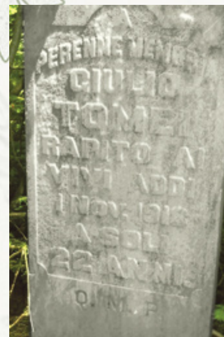
Pietra tombale di Giulio Tomei.