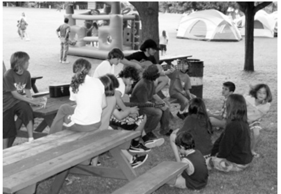
Un' immagine del campo giochi.

During the first week of July the Famèe Furlane of Oakville hosted a day camp for the members' children. The camp was held at the beautiful Fogolâr Country Club of Oakville. Fifty-three children attended the camp, ranging in age from 5 to 16 years old.