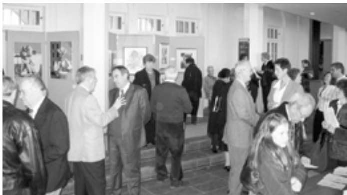
Uno scorcio della mostra d'arte.

Le ragioni per questi incontri sono tante: ci ritroviamo per rinnovare amicizie, per fare nuove conoscenze, per scoprire un po' di questo grande paese che è il Canada, per chiacchierare e per scambiarsi idee in friulano e per volgere lo sguardo al futuro: Ma ci incontriamo anche, perchè siamo fieri della nostra Piccola Patria e del nostro contributo, come friulani, al mosaico canadese. E, naturalmente, ci incontriamo anche per mangiare, bere, ballare, cantare, godere e, per ringraziare.