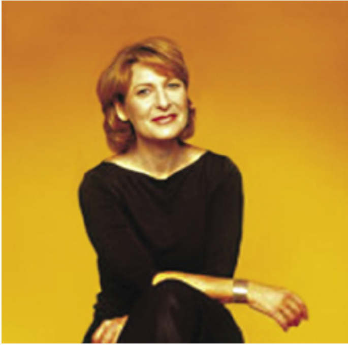
Anna Maria Tremonti.