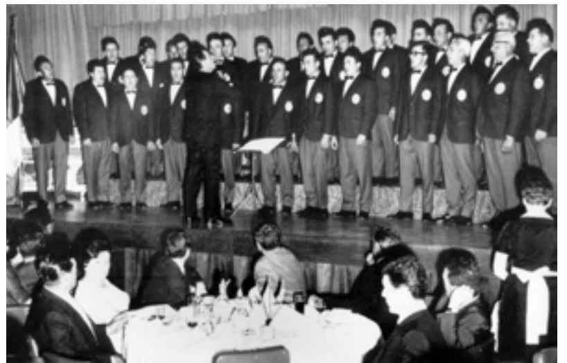
Il Coro di Santa Cecilia (1967).