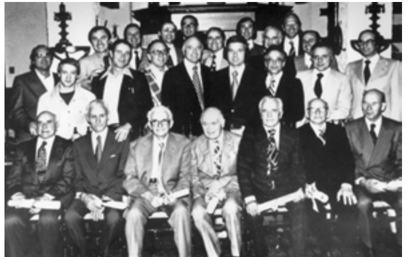
First Generation and Sons (1975).