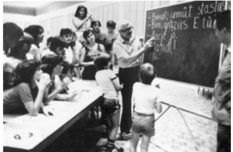
Scuola di Friulano (1980).

Il Ducato dei Vini Friulani e le Frece Tricolori hanno onorato la Famée Furlane in più d'una occasione, come pure mons. Piero Brollo, attuale arcivescovo di Udine. Graditissima pure la visita di mons. Abramo Freschi, vescovo di Concordia e Pordenone.