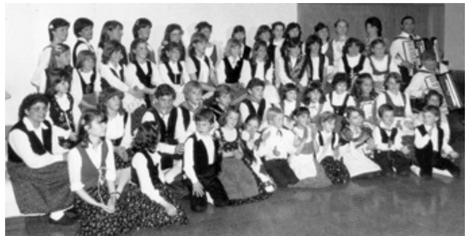
The Famée's Ballerins in Traditional Costume (1980).

Per il cinquantenario di fondazione del Sodalizio (anno 1982) viene presentato un pregiato volume sulla storia della Famée, illustrato da preziose fotografie.