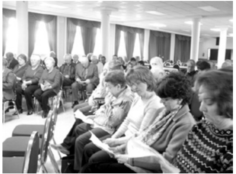
Ottawa - Membri e simpatizzanti alla Fieste dal Popul Furlan .

Una gran parte del direttivo è già da ora inserito nelle preparazioni per il Congresso "Fogolârs 2006".