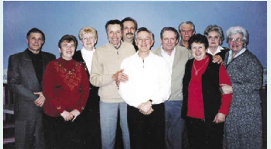
Il direttivo del Fogolâr Furlan della Niagara Penisola - 2004.

Anche quest'anno il Fogolâr Furlan della penisola del Niagara si dà da fare per organizzare progetti interessanti, cercando sempre di migliorare il "carnet" per la comunità friulana della zona.