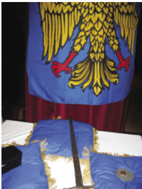
Tre significanti realtà della nostra storia: la bandiera del Friuli Patriarcale, la spada, il tallero e un pugno di terra della Piccola Patria alla Fieste dal Popul Furlan a Montreal.