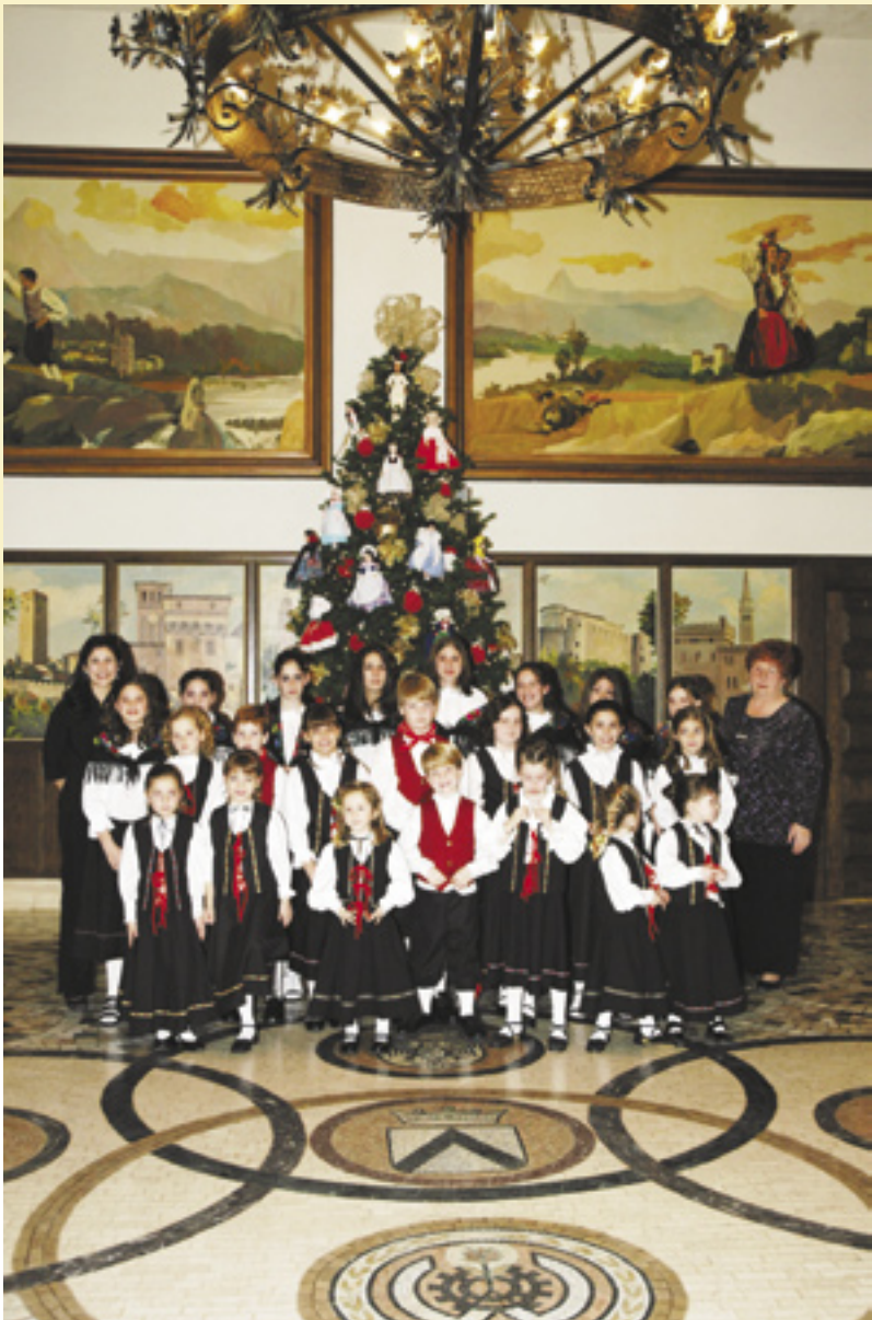
The Children's Choir at the Christmas Banquet.

With the winter slowly fading into a memory, the club is working on several events to bring in the Spring and Summer season. Upcoming events include Mother's Day Dinner, Spring Members' Banquet, Father's Day Mass and Picnic, Annual Golf Tournament, and many other events.