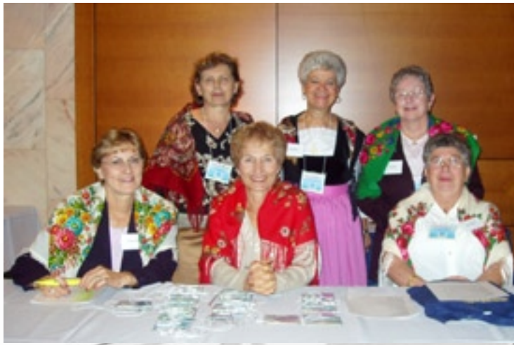
Vivaci costumi folcloristici friulani - Le Socie della Lega Femminile di Vancouver danno il benvenuto ai congressisti.