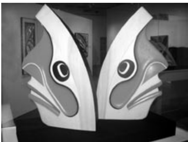
Immagine: Magnifici ed imponenti esemplari d'arte Haida - Gli Haida sono una popolazione autoctona della costa occidentale del Paese.

La profondità del messaggio assieme al filo di speranza e ottimismo espresso dal