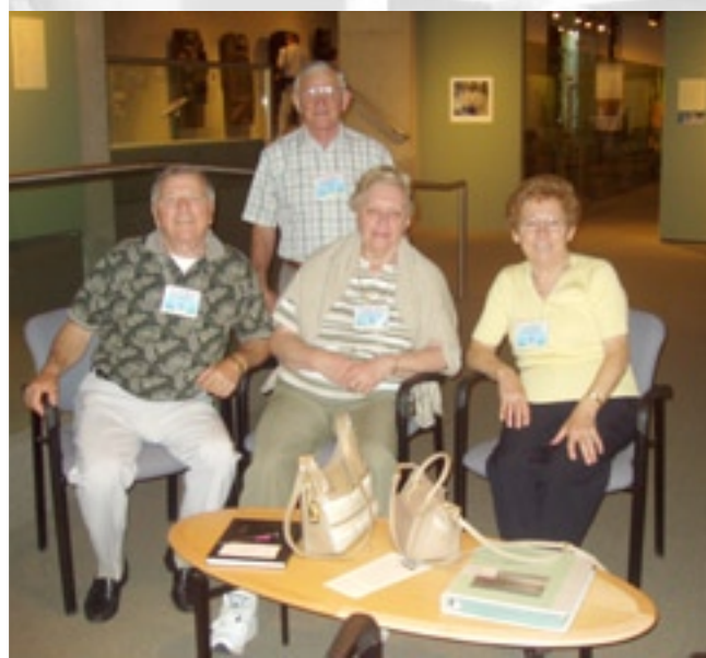
Occasione di ritrovo e ricollegamento - La rilevanza dell'aspetto sociale del convegno è una delle grandi attrazioni di questo evento biennale.