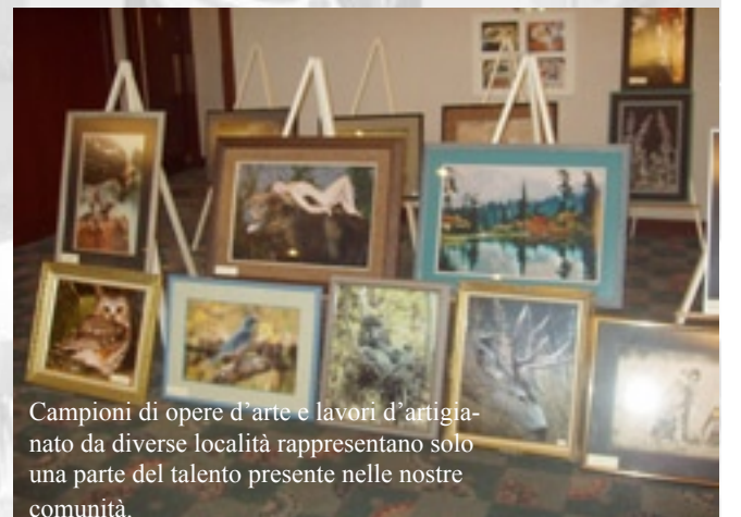
Campioni di opere d'arte e lavori d'artigianato da diverse località rappresentano solo una parte del talento presente nelle nostre comunità.