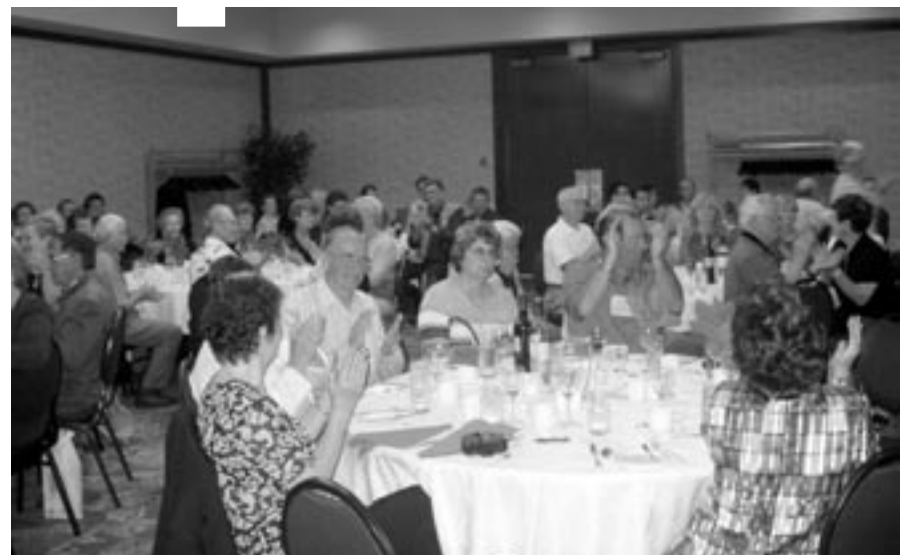
Cerimonia di chiusura - I delegati ripresi durante la colazione dell'ultimo gior-