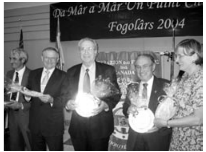
Cinque presidenti di Fogolârs che hanno ricevuto una targa ricordo per aver servito la loro comunità per più di dieci anni consecutivi. Mancano i presidenti di London e Niagara.