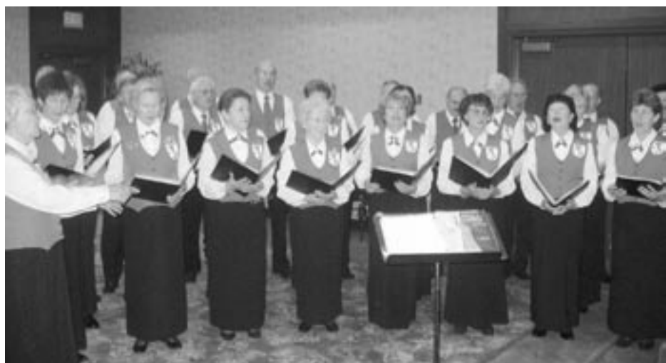
Si da inizio ai lavori - Il Coro Folcloristico Italiano della British Columbia intona gli inni nazionali.