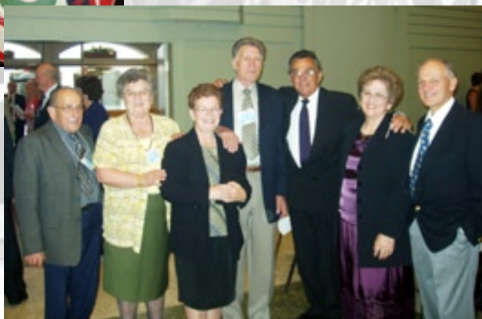
Momento di formale eleganza durante la serata di gala al Centro Italiano di Cultura.