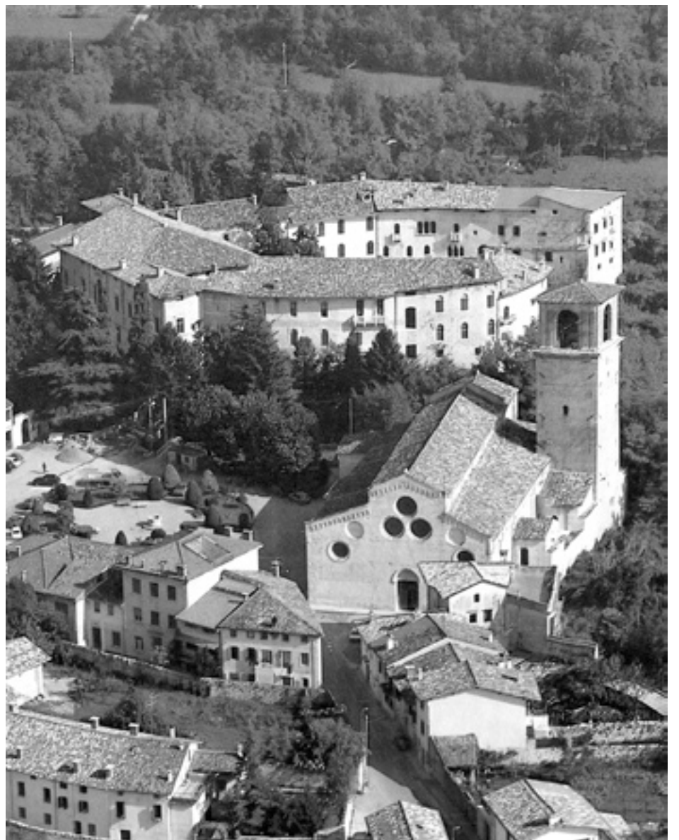
VEDUTA DI SPILIMBERGO CON IL DUOMO E IL CASTELLO. Tratta dal volume Vivere in Friuli dell'Ente Friuli nel Mondo.

Cisilute: Quale ruolo dovrebbe avere secondo te la Federazione dei Fogolârs nel tessuto delle nostre comunità?