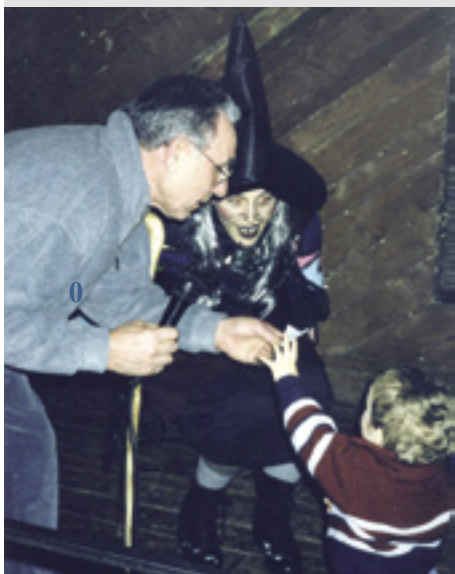
La Befana consegna i doni ai bambini.