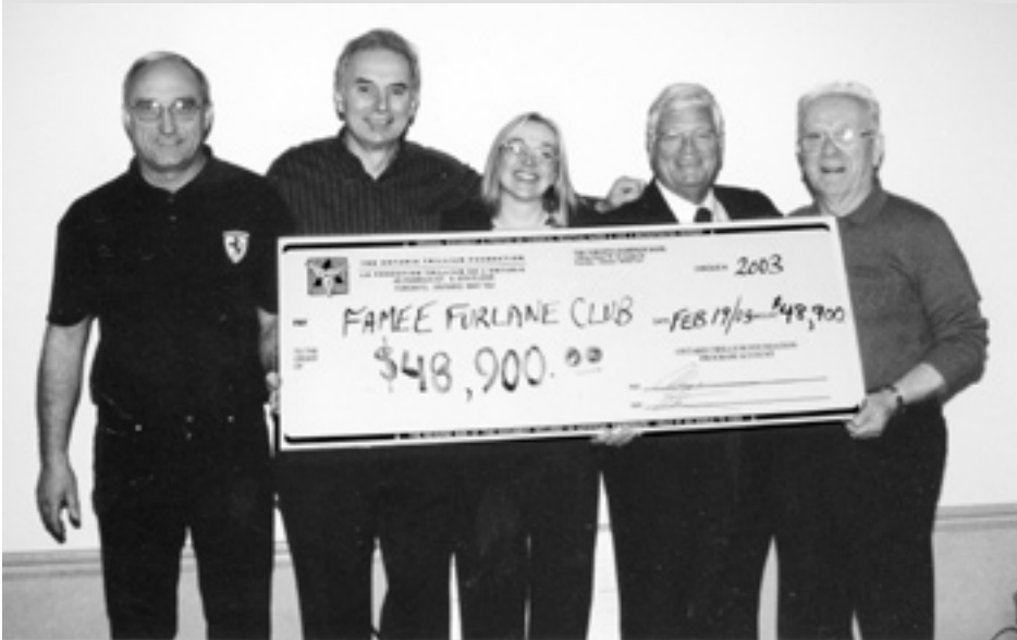
L'assegno per $48,900 ricevuto dal governo provinciale per il rinnovo dei lavatoi e la costruzione di un piccolo ripostiglio/magazzino.

Anche quest'anno il calendario della Famèe Furlane di Hamilton è pieno di attività. Come sempre si cerca di avere attività che coinvolgano la famiglia al completo, e la risposta è sempre buona. Perciò, si continua cercando di migliorarci sempre, sperando che l'avvenire dia buoni frutti.