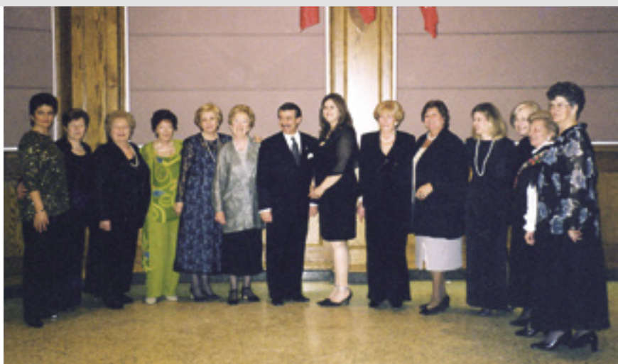
Il Comitato Esecutivo della Società Femminile Friulana di Toronto.