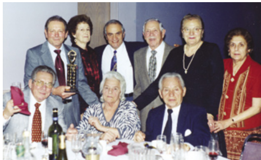
Un gruppo di friulani in visita dagli Stati Uniti per partecipare al Gala del Radicchio al Club Roma.

quelli giovani che non sono nati in Friuli. Speriamo che quelli presenti in questo giorno vengano a capire ed apprezzare le lidre culturale e geografiche dei suoi genitori e i suoi nonni. L'8 novembre tutti i nostri soci e amici del Fogolâr sono invitati di assistere alla Gala del Radicchio a Club Roma. Come sempre, questo ballo presenta una sera di gioia, canto e amicizia. L'ultima attività friulana sarà fatto nel mese di novembre. In questo giorno facciamo il nostro incontro generale dei soci e subito dopo festeggiamo la festa di Natale con un potuck .