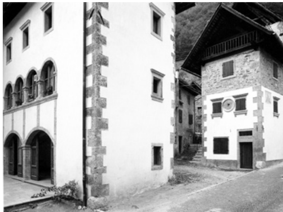
Edifici di grande pregio architettonico a Pesariis. Tratta dal volume Cjasis Furlanis dell'Ente Friuli nel Mondo.

La concezione di un viaggio per piacere era del tutto assente. In tempi più recenti c'è stata l'usanza del "viac di gnocis", che seguiva al matrimonio e consentiva agli sposi, rigorosamente inseriti nella