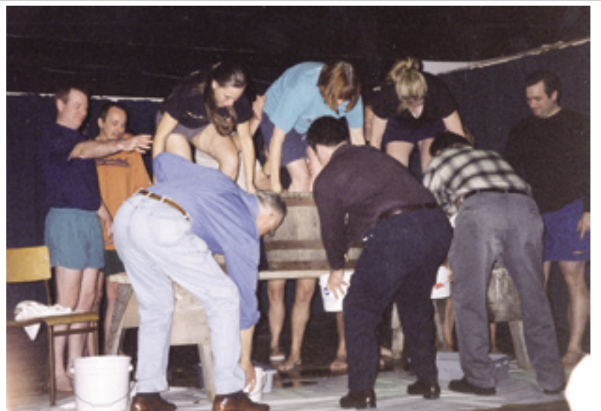
La gara di pigiatura alla Festa dell'Uva.

Durante le feste Natalizie si è svolta la