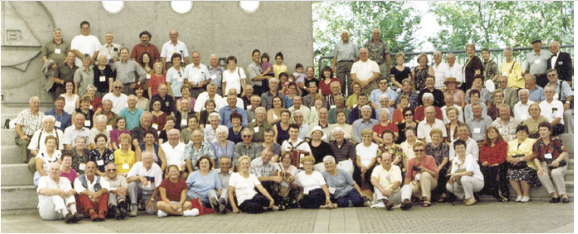
Delegates at “Fogolârs 2002” pose for a memorable photograph.

There has been no greater event in the life of the Friulan community of this city than that of “Fogolârs 2002” and at the risk of sounding redundant we would like to revisit September 2002. The congresso was a tremendous success and the Friulans of Sault Ste. Marie would like to extend their heartfelt thanks to everyone who helped to make this event so memorable.