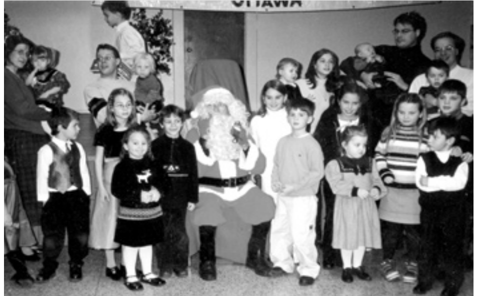
Bimbi friulani con Babbo Natale.

Il Fogolâr Furlan di Ottawa ha continuato con i programmi di carattere sociale, ricreativo e particolarmente culturale. Il sodalizio da qualche anno organizza le feste di Carnevale e la Festa d'Autunno in collaborazione con il Club Vicentino di Ottawa. I due gruppi, avendo notato che la sommando le risorse dei due club si otteneva una maggiore partecipazione di quando si organizzavano feste separatamente, organizzano ora queste feste insieme. In realtà, sono attività che servono a mandare avanti il sodalizio e grazie al lavoro volontario degli organizzatori, cuochi, baristi...ecc, queste feste hanno molto successo e assicurano la sopravvivenza finanziaria del club.