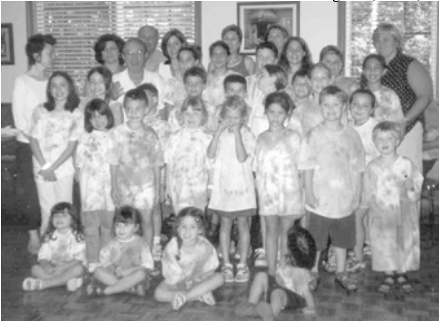
Oakville - 30 children participated in this year's Campo Giochi. arts and crafts.

In early July, Campo Giochi was again offered and 30 children took part. Should this program not continue in future years, the Famèe will look into doing something else on its own. We have a terrific location and with the proper staff we could provide our children with an excellent program of Friulan games, music, and