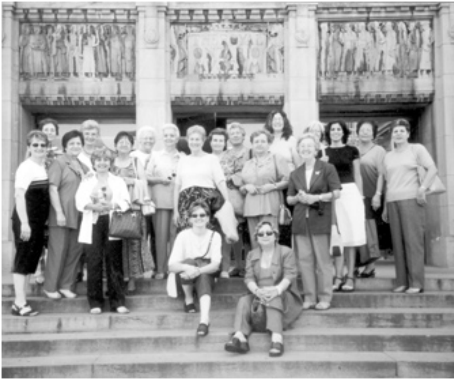
Società Femminile Friulana di Toronto - In gita alla galleria d'arte di Kleinburg.