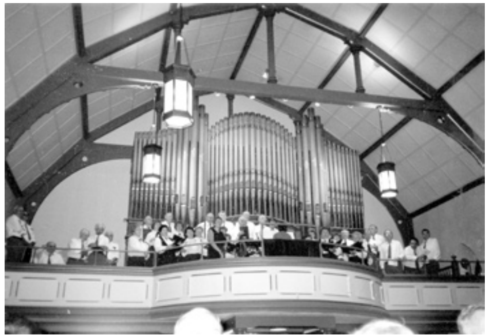
Domenica 1 settembre - Il coro Santa Cecilia e il coro le Voci del Friuli si preparano ad accompagnare con il loro canto

Un affettuoso saluto e un vivissimo ringraziamento a tutti i partecipanti, giunti anche da regioni molto lontane di questo grande Paese e dagli Stati Uniti, per la serietà e lo spirito di grande amicizia con cui hanno vissuto le giornate congressuali. Ci attende un grande impegno di lavoro per