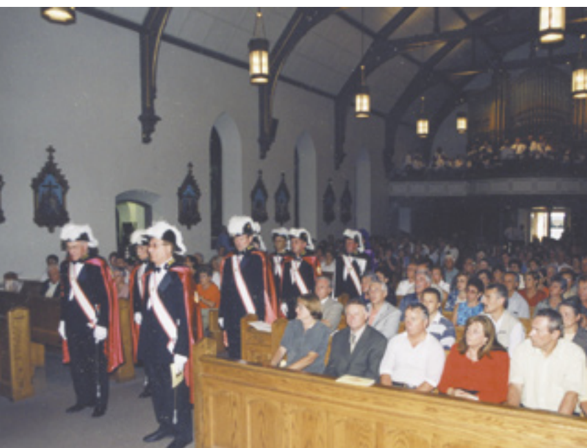
L'ingresso dei Cavalieri di Colombo nella gremita Cattedrale del Preziosissimo Sangue all'inizio della S. Messa.