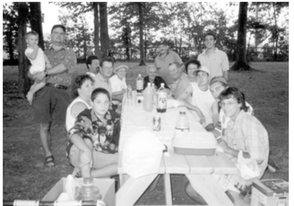
Niagara – Picnics are wonderful gatherings for friends and families.

On December 8, the Fogolâr Furlan held its regular General Meeting and Christmas Potluck in Niagara Falls. The families of our club enjoyed each