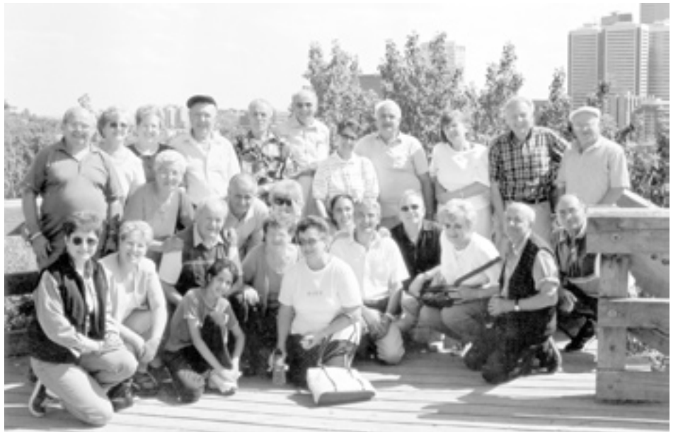
Edmonton - Un bellissima foto del gruppo che ha fatto una visita alla città di Calgary.

Anche quest'anno il calendario del Fogolâr di Edmonton è pieno di attività. In primis la nostra annuale cena con ballo per i membri. Menu comprendente polenta, muset e bruade. Grande goduria e divertimento. Il 7 luglio il nostro picnic a cui presenziarono anche gli amici di Calgary. Gare di bocce, tornei di carte e quant'altro. Grande divertimento per grandi e piccini. Il 27 e 28 luglio siamo andati a Calgary a contraccambiare la visita ai nostri amici partecipando al loro picnic. Il giorno 27 abbiamo fatto una visita alla città di Calgary durante la quale la presidentessa del Fogolâr di Calgary ci ha fatto da guida. Oltre che la visita dei punti più caratteristici della città, lei ci ha anche dato un commentario storico e di ciò le siamo molto grati. Il 3 novembre ci fu la nostra riunione generale. Alla conclusione vennero servite pizza e caldarroste. Per quanto riguarda il futuro, domenica 8 dicembre ci sarà l'incontro di Babbo Natale con i più piccini. Per il prossimo anno stiamo progettando una gita possibilmente a