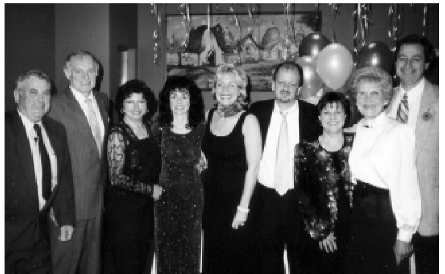
Il comitato esecutivo ripreso nel corso del banchetto.

In aprile il nostro sodalizio terrà le elezioni dell'esecutivo. Quindi avremo il banchetto annuale seguito a breve scadenza dal picnic. Questo completerà la stagione estiva, dopo un breve periodo di riposo saremo pronti ad affrontare le nostre attività invernali.