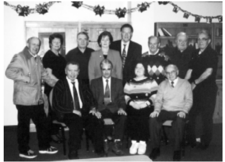
Il nuovo comitato esecutivo.