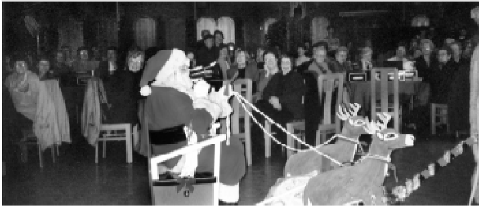
Babbo Natale sulla sua slitta trainata da due renne sfila tra gli applausi entusiasti delle nostre socie. La Festa di Natale è stata un grande successo di allegria e di soddisfazione per le nostre socie.