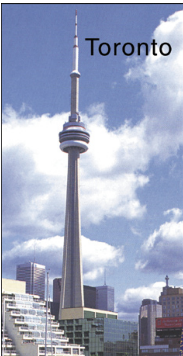
A view of Toronto’s CN Tower, taken from marina in the harbour

o incontrerete i vostri amici da Canada in occasione del Wine and party che aprirà il Congresso, non rebbe raccontare le vostre avventure durante il Tour pre-Congresso? e il Congresso vi proporremo i nali gruppi di lavoro, nuovi spettacoli ica cucina ed ospitalità friulana. In nma ci sarà un giro per Toronto comprendente ciera attraverso le isole del porto, durante la