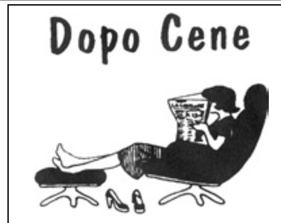
Poesie di Enzo Driussi cjolte dal libri "KUKES"