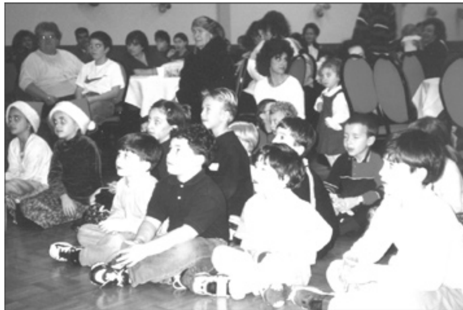
Christmas party for children of Fogolâr Furlan Edmonton, December 5, 1999.