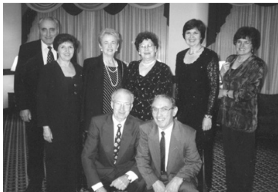
Una delegazione del Fogolâr, assieme al loro presidente e alla presidente della Federazione, a New York in rappresentanza della comunità friulana in occasione del 70° anniversario della fondazione della Famèe americana.

Cara Cisilute ancora una volta (sarà forse la mia ultima) t'inviamo due righe, faremo del nostro meglio per soddisfare le tue richieste. Speriamo di essere scusati se per caso diamo notizie già in passato riportate.