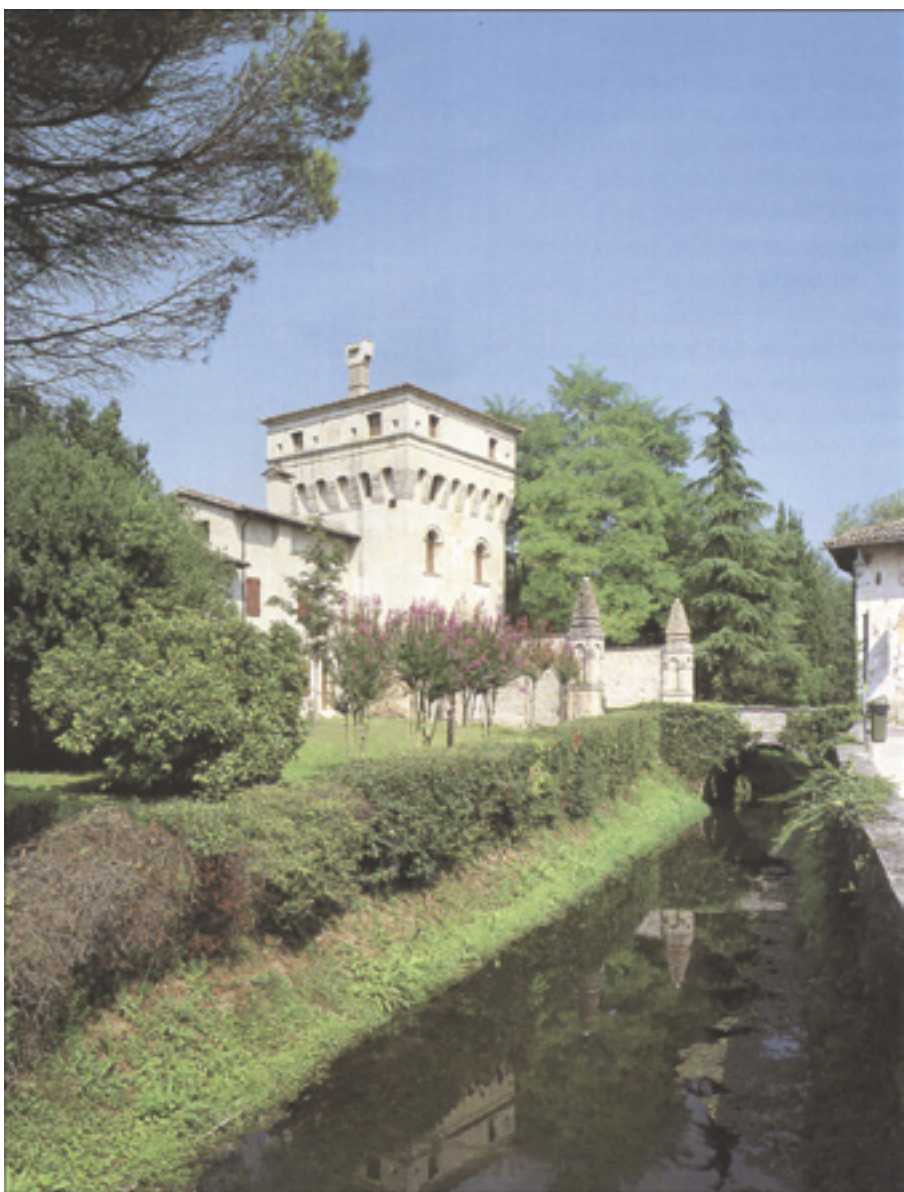
La torre d'ingresso dell'Abbazia di Sesto al Reghena. Sesto al Reghena sito dell'incontro annuale dei Friulani nel Mondo