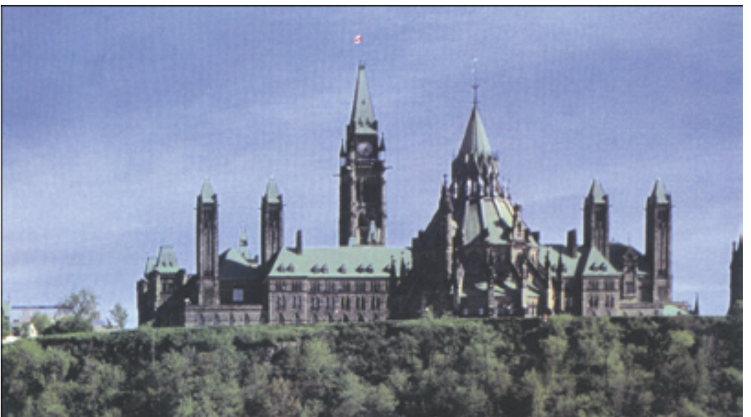
Welcome to Ottawa, prettily situated on the Rideau Canal and Ottawa River

'Across the Country, Across Generations'